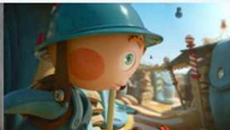
Film : La détente

Un court-métrage sur les horreurs de la guerre.