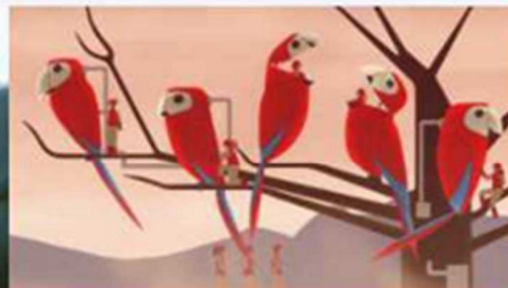
Film : Floreana

Un film pour réfléchir à nos relations avec les animaux.