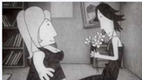
Film : Yulia

Un court-métrage sur la domination masculine et les violences conjugales.